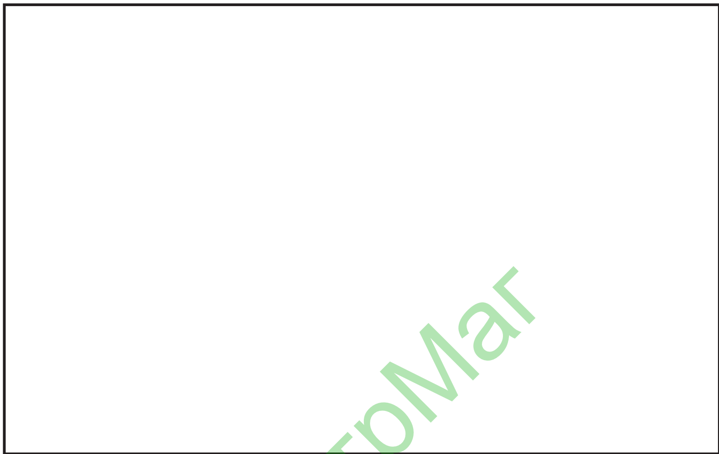
ФОТО №1 Общий вид сооружения Схема сооружения