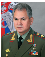
Герой Российской Федерации генерал армии ШОЙГУ Сергей Кужугетович